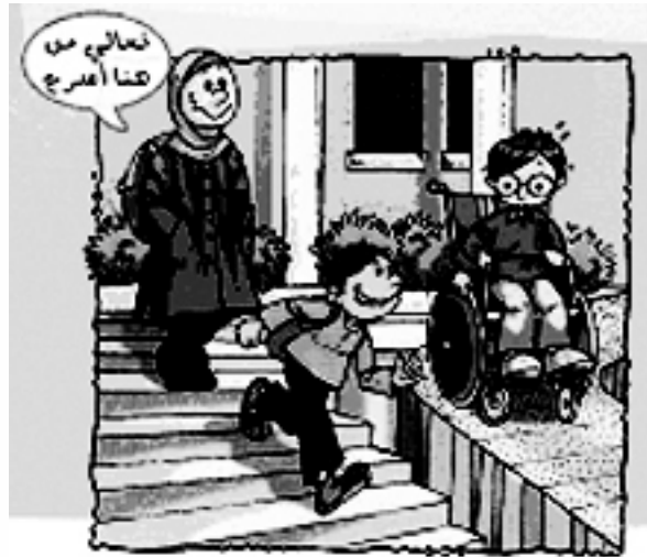
نراعي ظروف الآخرين ونقدر إمكانياتهم