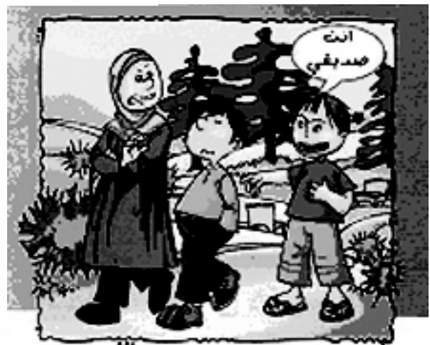
نحترم الآخرين معها كأنه قدراتهم