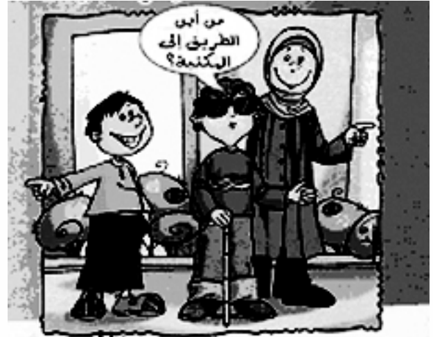
نتعامل مع أصحاب الحاجات الخاصة بلغة مفهومة