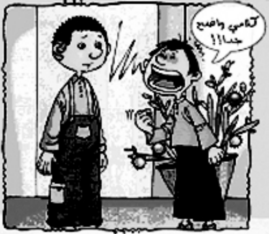
نبتعد عن الصراخ ونتواصل مع الآخر بحسب قدرته