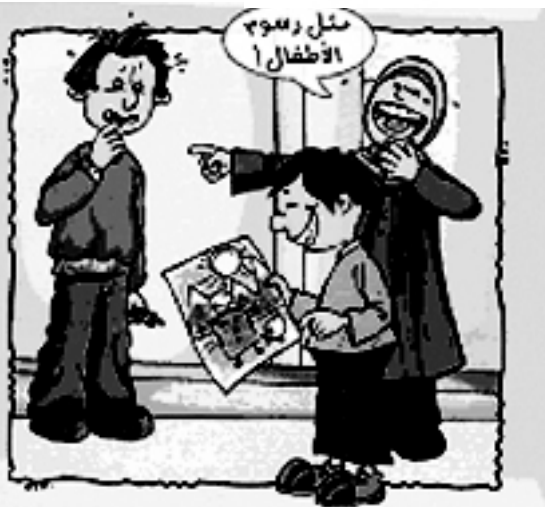
نلني على نجاحات أصدقائنا معها كأنه بسيطة